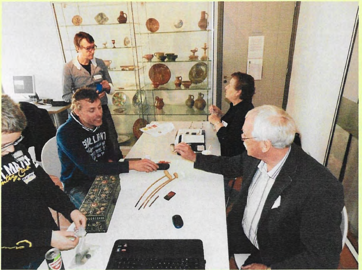
Het determinatieteam in actie op de ruilmiddag in de Rijp. Meer hierover op de naastgelegen pagina.