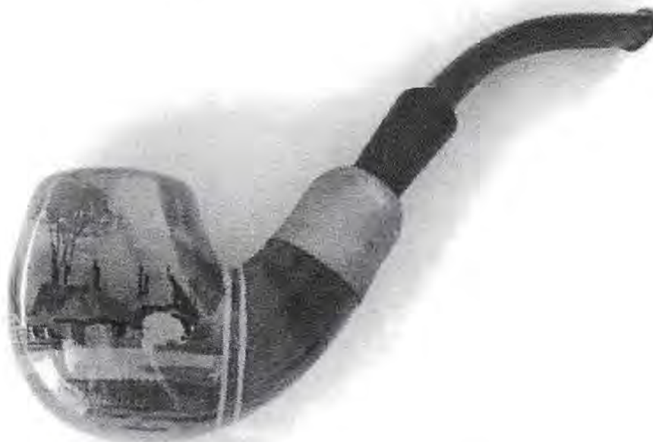
Afb. 5, Landschapje. Gouda, Ivora. H.41, B.32, O.21 mm

In hoeverre deze pijp betrekking heeft op de eerste wereldoorlog werd niet duidelijk. Mogelijk was een ambtsjubileum de aanleiding tot bestelling van deze pijpenkop. Het verhaal van de eerste eigenaar en zijn relatie met deze drie pijpen, bleef echter in rook gehuld.