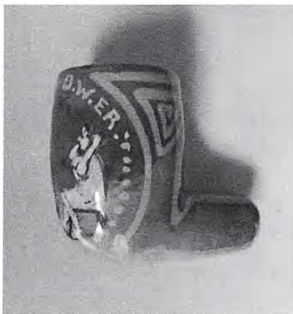
Afb. 2, "OOK. EEN. O.W.ER", Gouda, Ivora. pijp H.43,5, B.30,5, O.22 mm