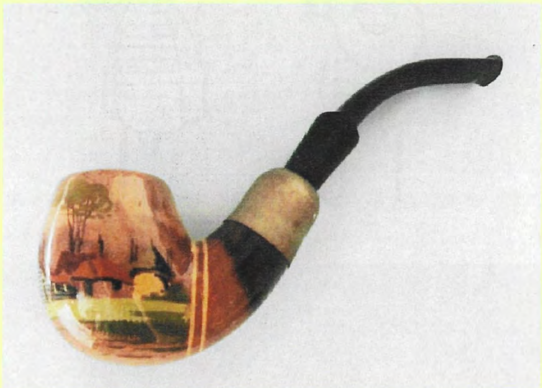
Plateelpijp van de firma IVORA met een landschap. Zie artikel op pagina 20.